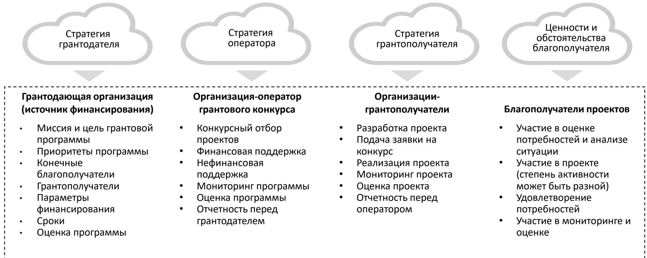
Схема грантовой программы